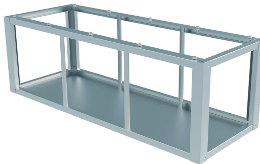
Markfundament höjd 500mm i rostfritt