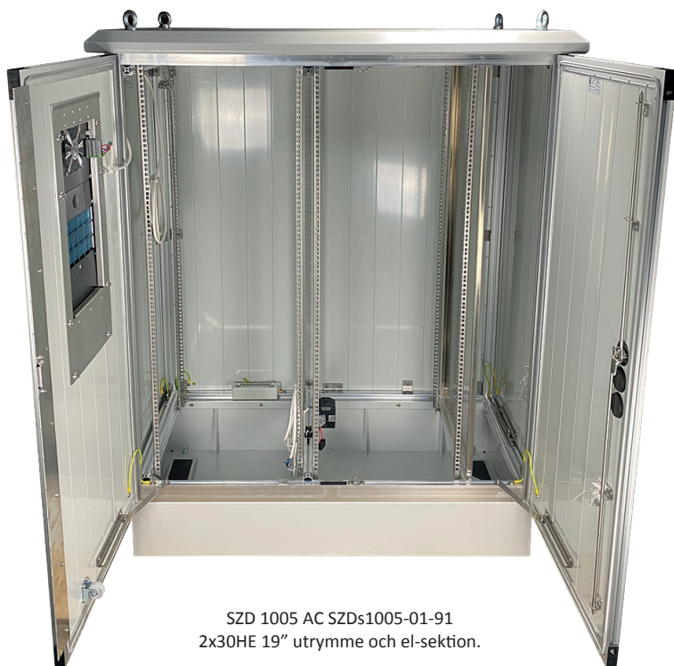
SZD 1005 AC SZDs1005-01-91 2x30HE 19" utrymme och el-sektion.